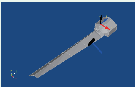
ジオメトリ上の測定 DOF 表示